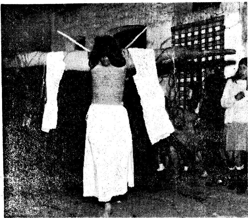
PROCESION DE LOS «EMPALADOS». Valverde de la Vera. — En este pueblo de la provincia de Cáceres, se celebra anualmente en el Jueves Santo la famosa procesión de los «Empalados». Van los penitentes cubiertos sus cuerpos con una gran cuerda y llevan sobre sus hombros un madero, como puede apreciarse claramente en la fotografía.

Cuando termina la procesión, el abad de turno muestra su satisfacción agradeciendo a los braceros, cansados y sudorosos, el esfuerzo realizado, con estas palabras de ritual: «¡Que Jesús os lo pague!». Y hasta el año próximo, si Dios quiere.