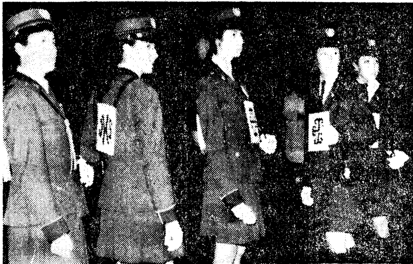
MALAGA, 30. — Miembros de la Policía Municipal Femenina de Córdoba, que acompañaron el «paso» del Cristo de la Humillación en su desfile procesional de la Semana Santa malagueña.

eso, el habitante de barrios o zonas extremas de la ciudad puede olvidarse de la expresión litúrgica de estos días. Pero le bastará acercarse al centro durante las jornadas entrañables y devotas del Jueves y Viernes Santo, para que un redoble de tambor un brillante agudo de trompeta le pongan en situación y pueda ver, recordadas sobre el cielo de la Villa, las dulces imágenes de la devoción madrileña. — Julio TRENAS.